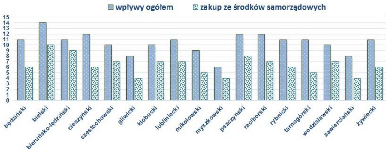
Wskaźnik nabytków w powiatach ziemskich w 2010 r. (w przeliczeniu na 100 mieszkańców)