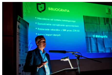
Jakub Salamon

wraz ze zintegrowanym katalogiem (OPAC) w oparciu o format MARC21. W programie można załączać i przechowywać dodatkowe pliki (załącznik z treścią zgodnie z prawami autorskimi, materiał ikonograficzny, filmy), stworzone są formu-