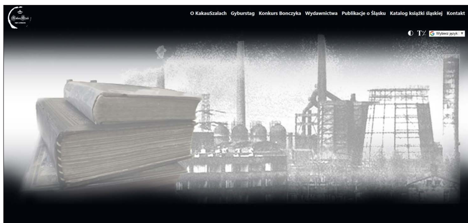
Widok strony głównej „Kakauszale” (nowa wersja)