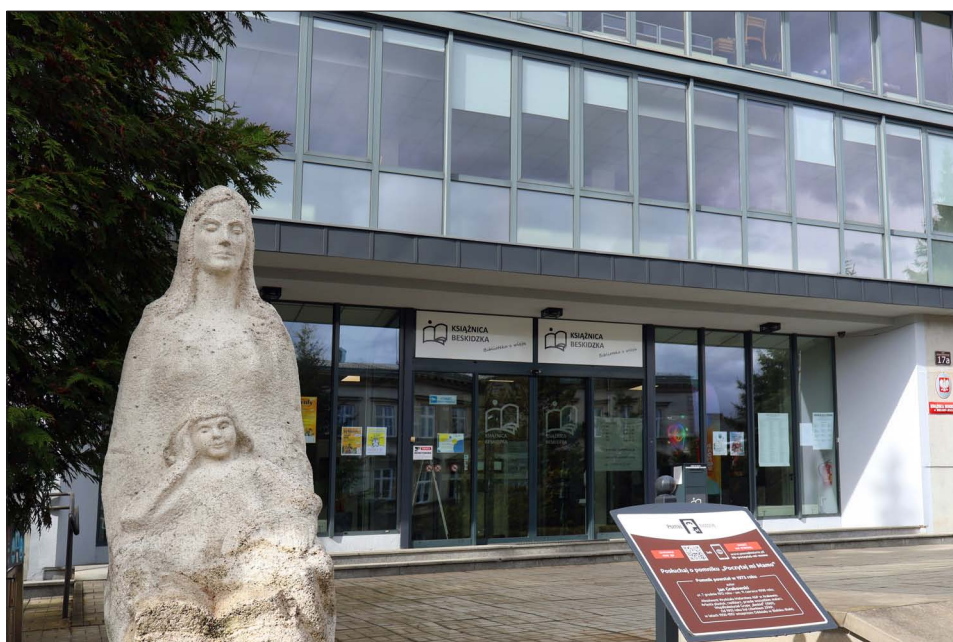
Książnica Beskidzka w Bielsku-Białej