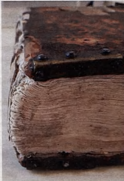
Oprawa egzemplarza Opus restitutionum ze zbiorów Biblioteki Śląskiej, z widocznymi ćwiekami na dolnych krawędziach desek