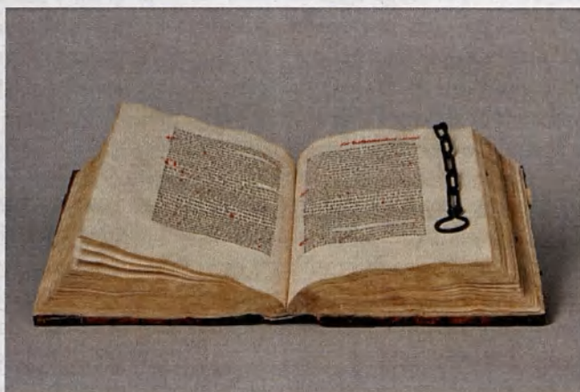
Egzemplarz Opus restitutionum ze zbiorów Biblioteki Śląskiej